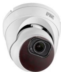
* Zdjęcie poglądowe