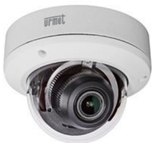
* Zdjęcie poglądowe